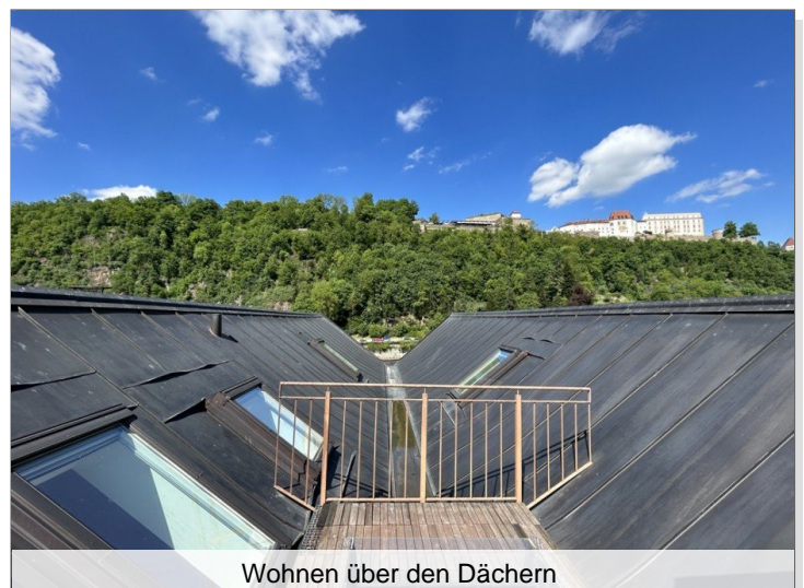
Wohnen über den Dächern