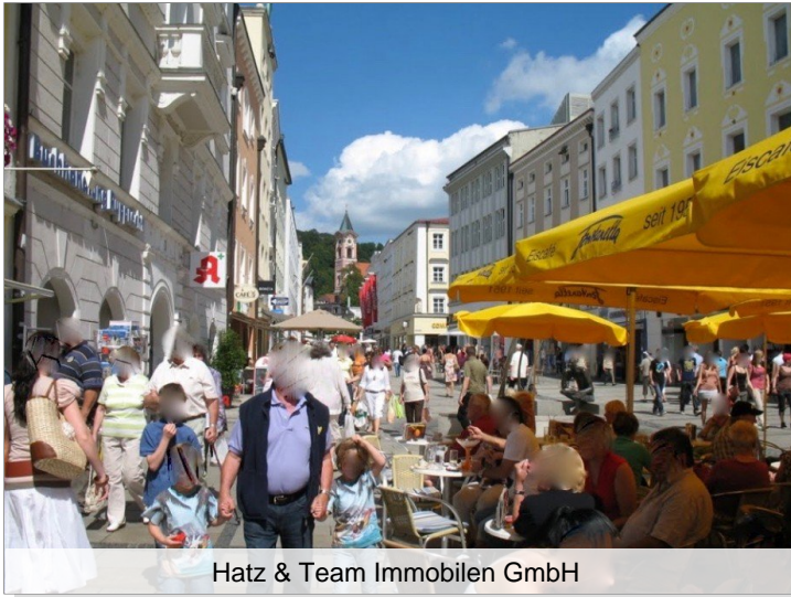
Hatz & Team Immobilien GmbH