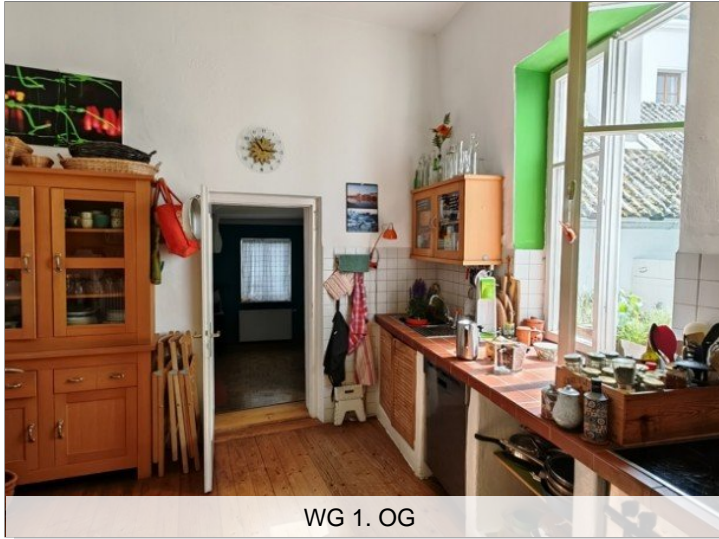
WG 1. OG