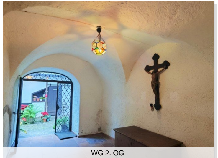
WG 2. OG