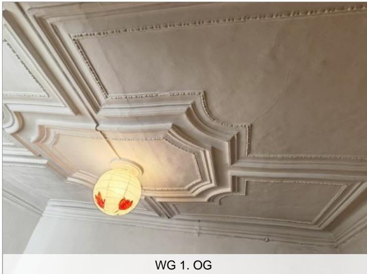
WG 1. OG