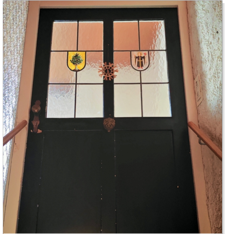
Aufgang 2. OG