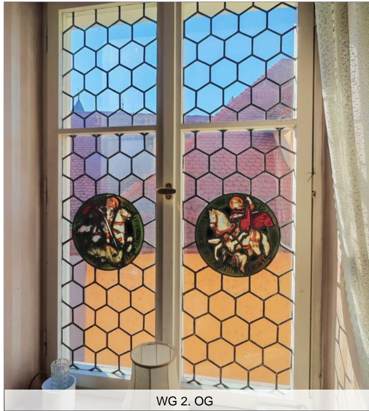
WG 2. OG