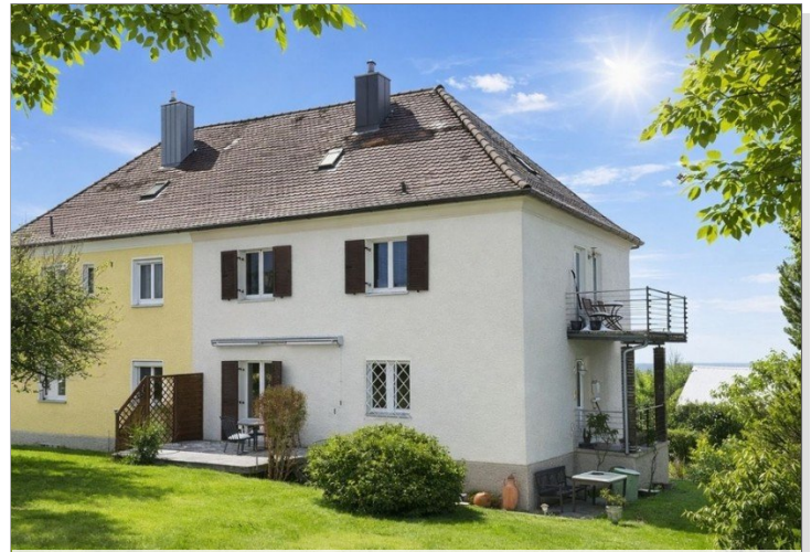
Hatz & Team Immobilien GmbH