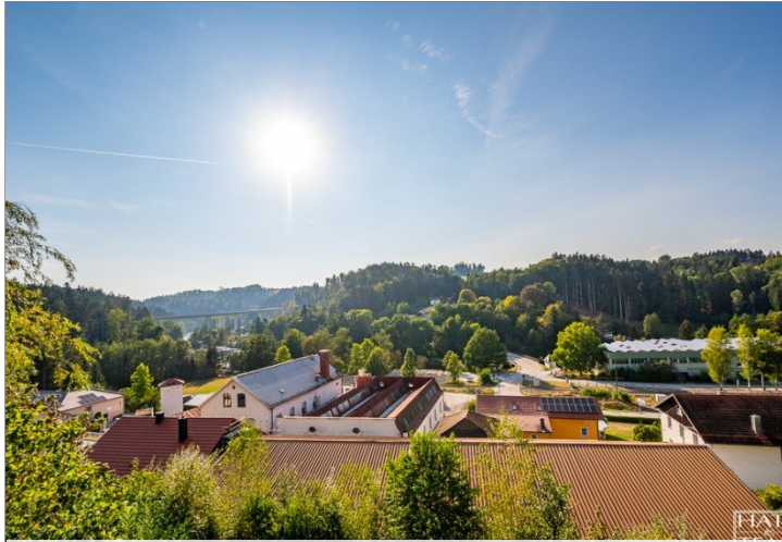
Ausblick von Balkon