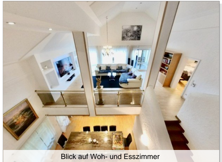
Blick auf Woh- und Esszimmer