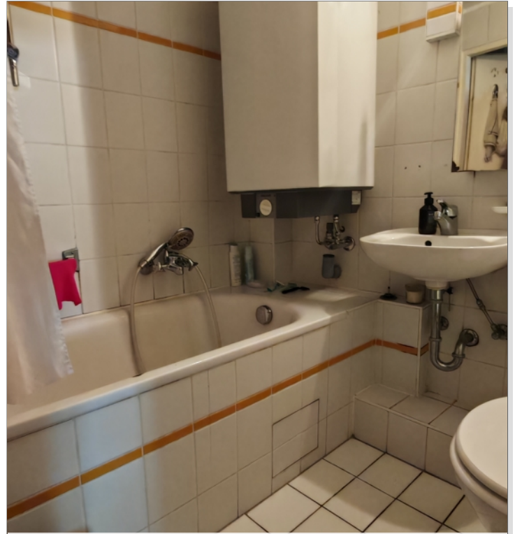
1. OG große WG