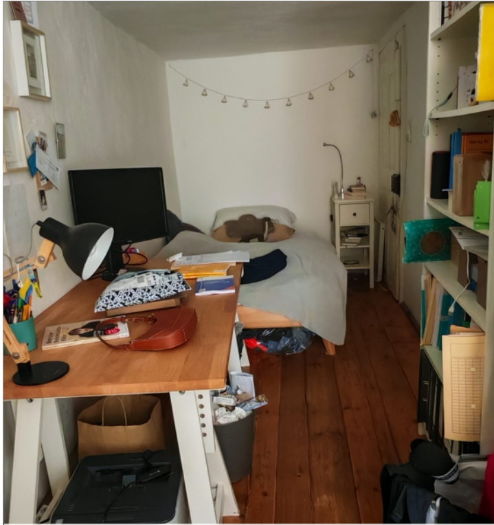
1. OG große WG