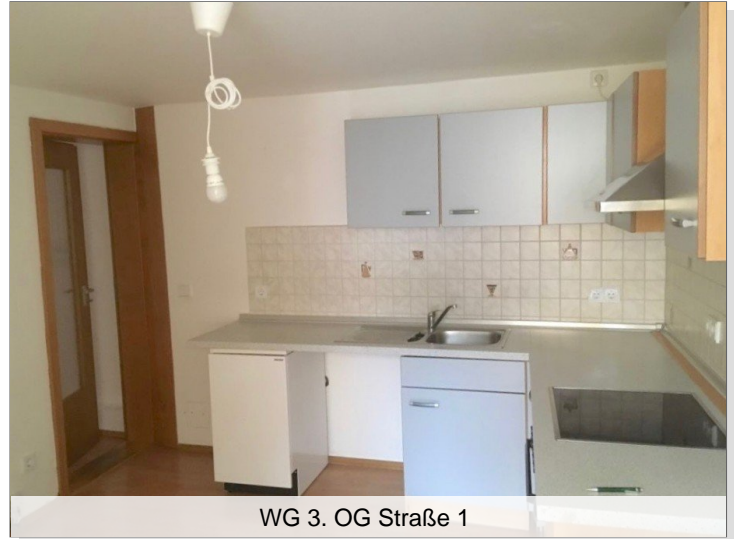
WG 3. OG Straße 1