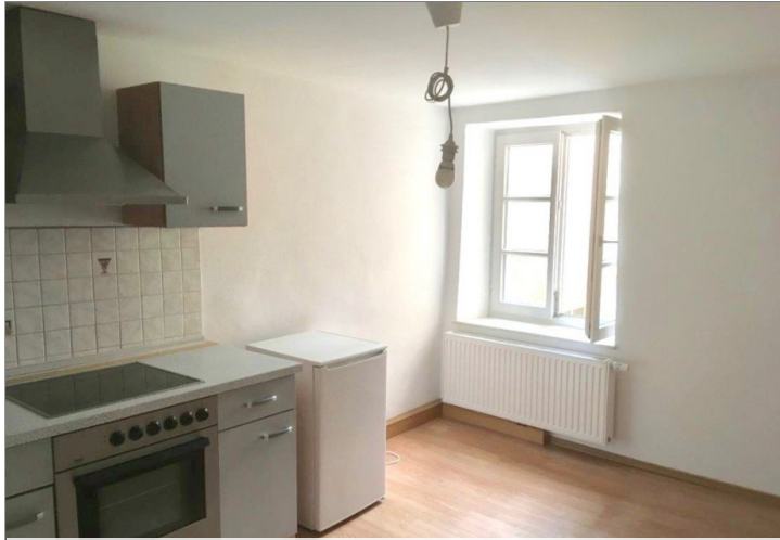
WG 3. OG Straße 2