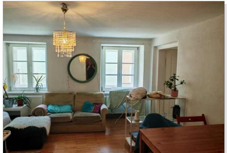
1. OG große WG