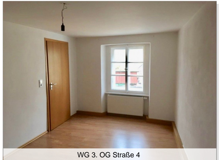
WG 3. OG Straße 4