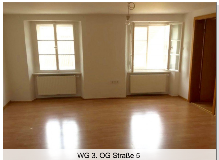
WG 3. OG Straße 5