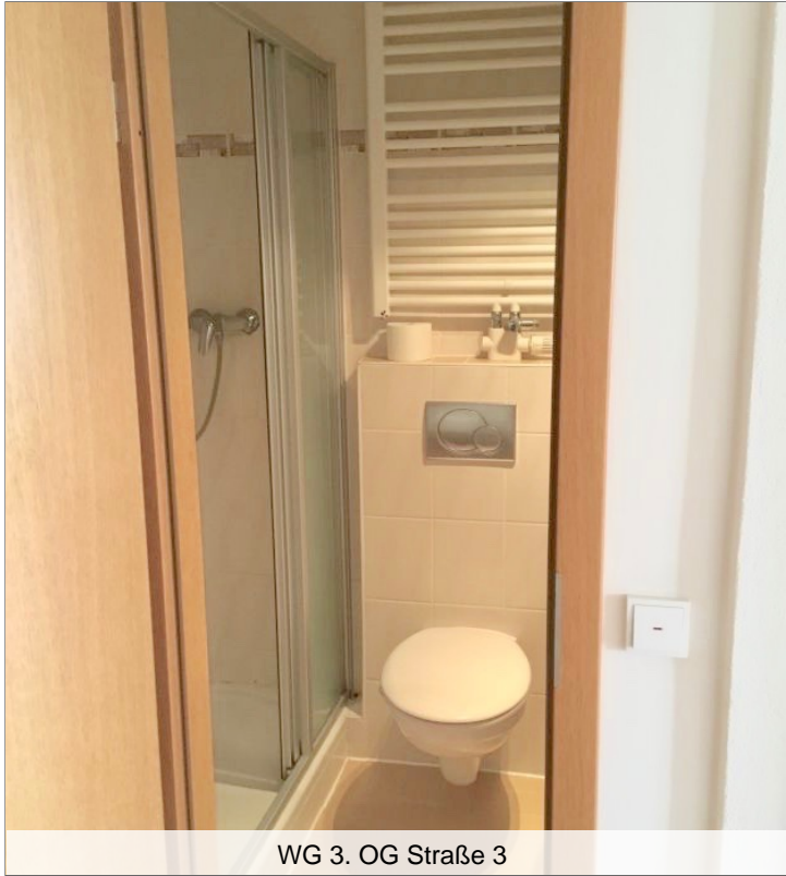
WG 3. OG Straße 3