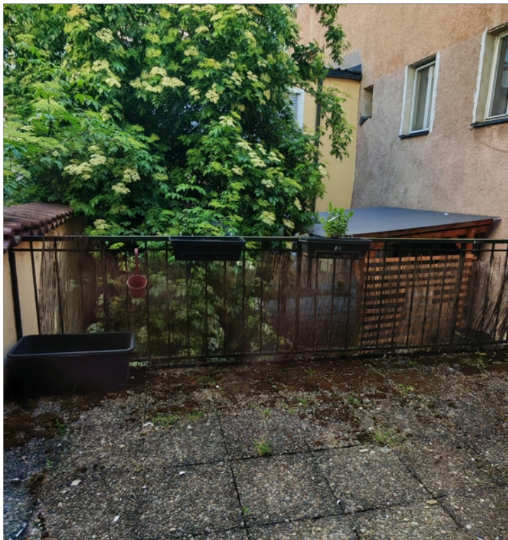
1. OG große WG