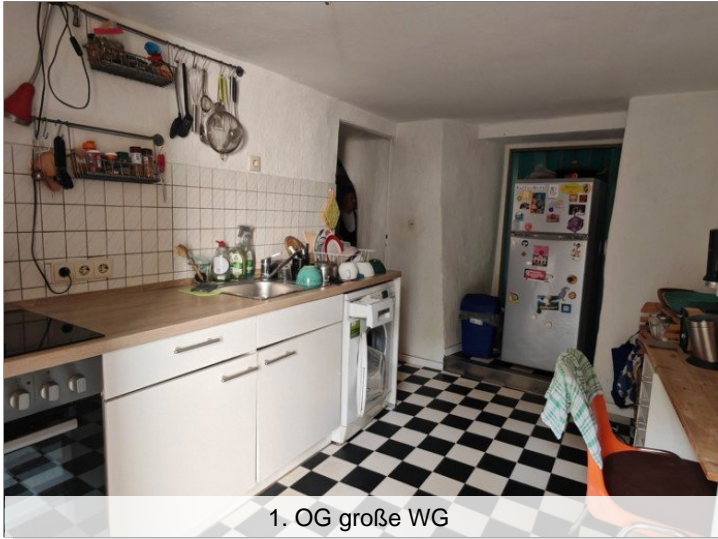
1. OG große WG