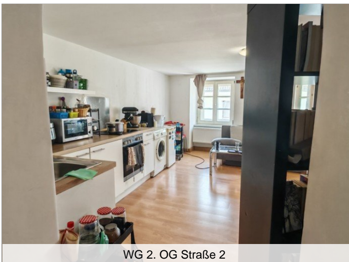
WG 2. OG Straße 2