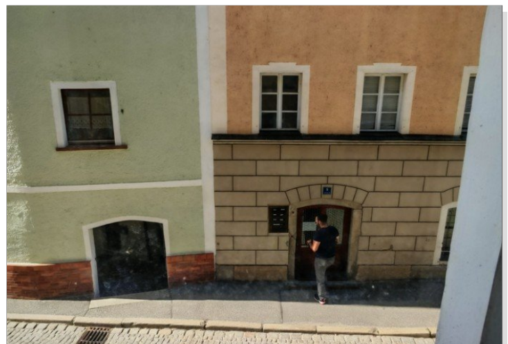
1. OG große WG