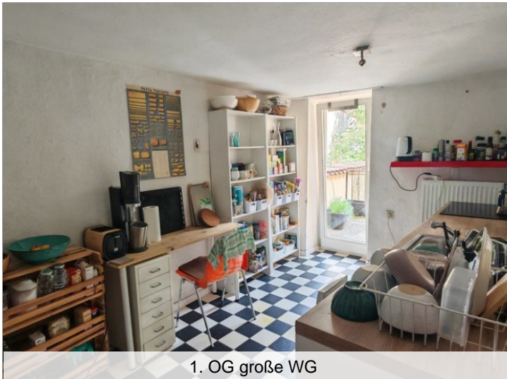
1. OG große WG