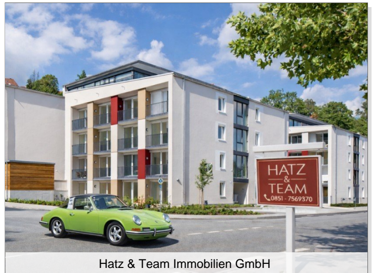
Hatz & Team Immobilien GmbH