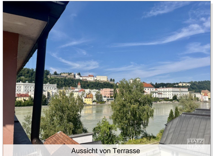
Aussicht von Terrasse