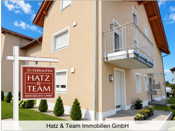
Hatz & Team Immobilien GmbH