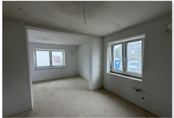
Küche / Essen