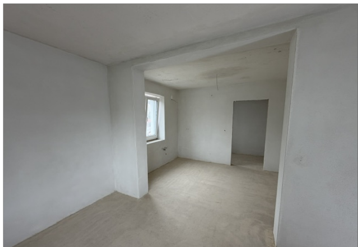
Küche / Essen