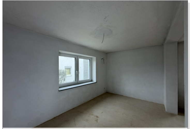
Küche / Essen