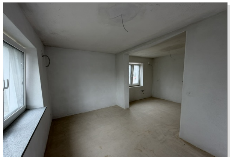
Küche / Essen