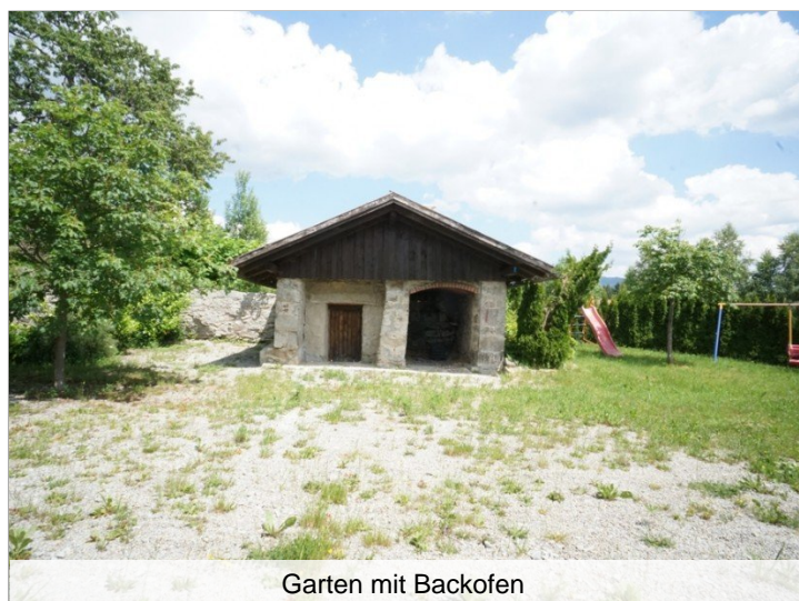
Garten mit Backofen