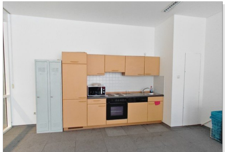
Aufenthalt mit Küche