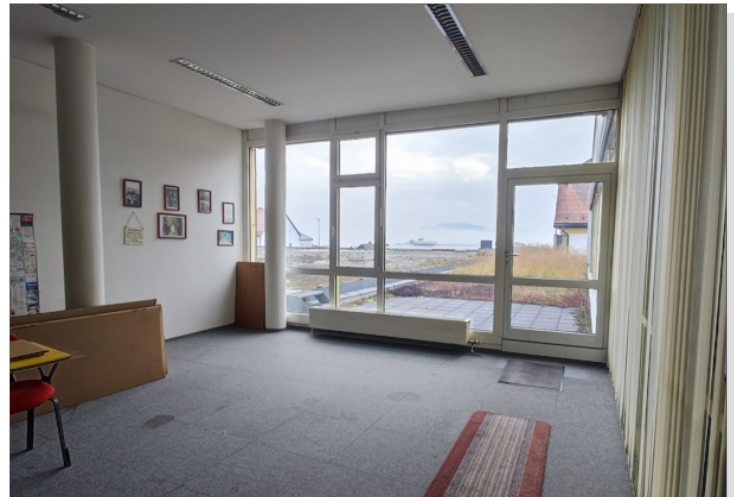
Aufenthalt mit Küche