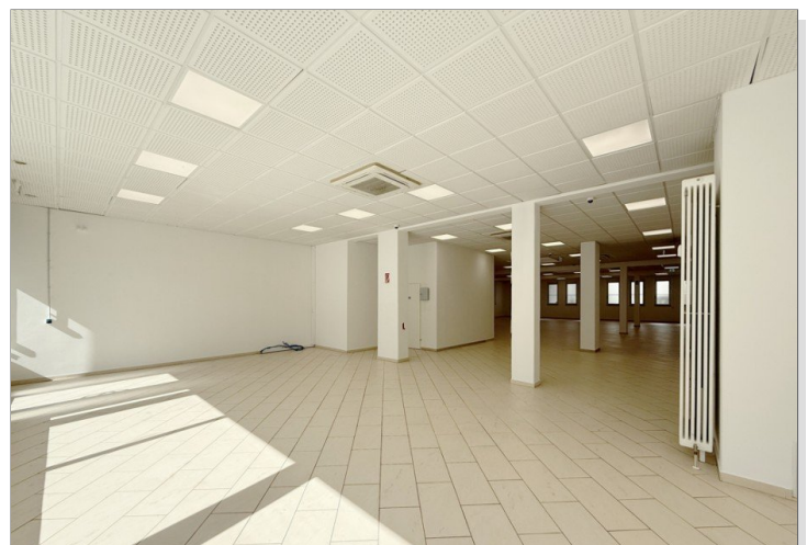
Ladenfläche 1 bearbeitet