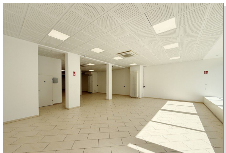
Ladenfläche 2 bearbeitet