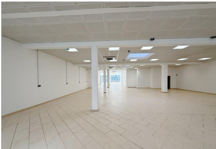
Ladenfläche hinten bearbeitet