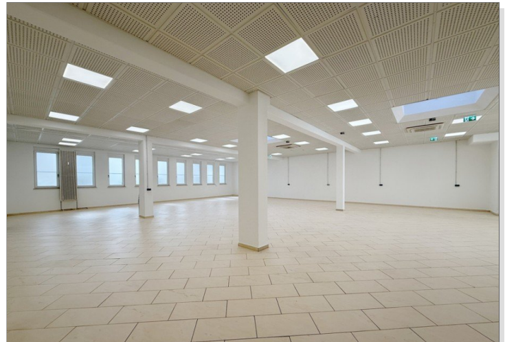
Ladenfläche 2 hinten bearbeitet